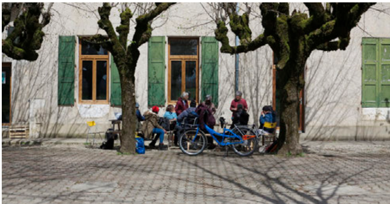
Les bénévoles animent également des ateliers de cuisine, d'apiculture ou encore d'artisanat, ouverts à tous.