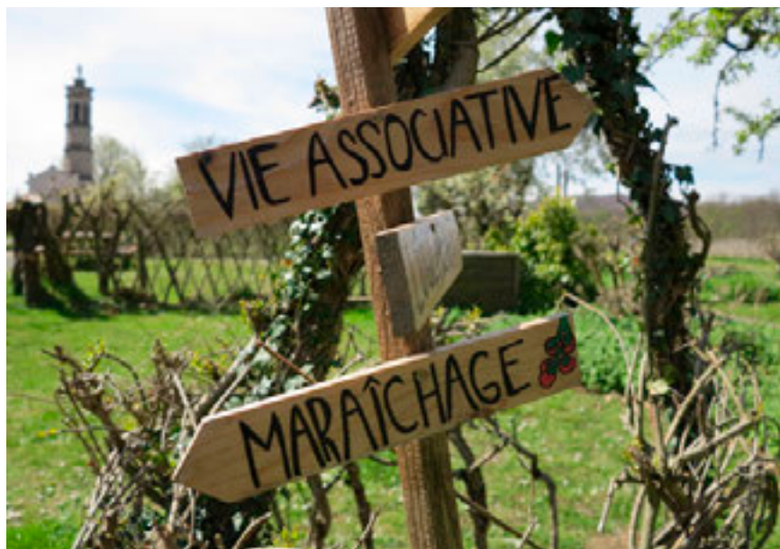
Compost partagé, boîte à livres... le jardin de l'ancien couvent est un lieu de vie partagé avec les habitants du village.